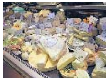
Die Qual der Wahl: 120 Käsesorten. ZVG