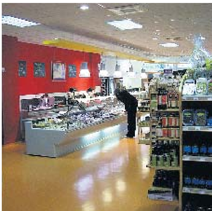
360 Quadratmetern gefüllt mit einem Vollsortiment an Bioprodukten.

Ob Käse, Gemüse, Obst oder Wein, Körperpflege- oder Molkerei-Produkte, knusprige Brote, Fleisch oder ein anderes Produkt aus dem reichhaltigen Sortiment: Besuchen Sie den Biomarkt Hauser in Lauchringen und finden Sie selber heraus, was Ihnen am besten schmeckt. (hdi)