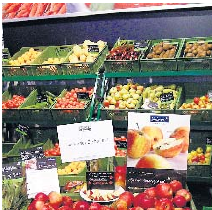
Lust auf Vitamine? Knackige und frische Früchte liefern sie.