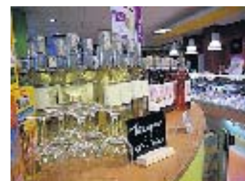
Bio-Weine in Spitzenqualität.