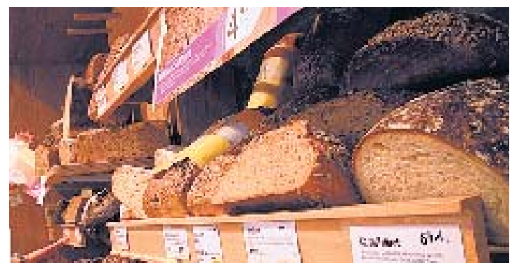
Brot-Brot: Täglich frisch und auch nach ein paar Tagen noch ein Genuss.